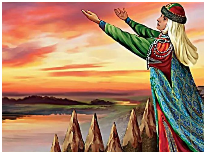
Рисунок 1 – Ярославна на городской стене Путивля

По своей направленности (и в значительной мере – по структурно-семантической организации) «плач Ярославны» является языческой молитвой, текстом-заклинанием, основанным на вере в силу слова. Об этом свидетельствуют не только представленные здесь обращения к опозитизированным стихиям, но и изложение трагических ситуаций – как внешней (военное поражение княжеской дружины), так и внутренней (тяжелое, «на грани срыва» морально-психологическое состояние самой Ярославны), а также использование риторических вопросов и выраженных в императивной форме просьб-побуждений. Очевидно при этом, что Ярославна воспринимает ветер и солнце как «недружественные» стихии, усугубляющие и без того сложные условия, в которых оказался князь Игорь со своей дружиной во время неудачного для них военного похода на половцев. При этом водная стихия – Днепр – характеризуется женщиной как могучий магический помощник, который в состоянии соединить ее с любимым человеком ( Възледей, господине, мою ладу къ мне, а быхъ не слала къ нему слезъ на море рано ).